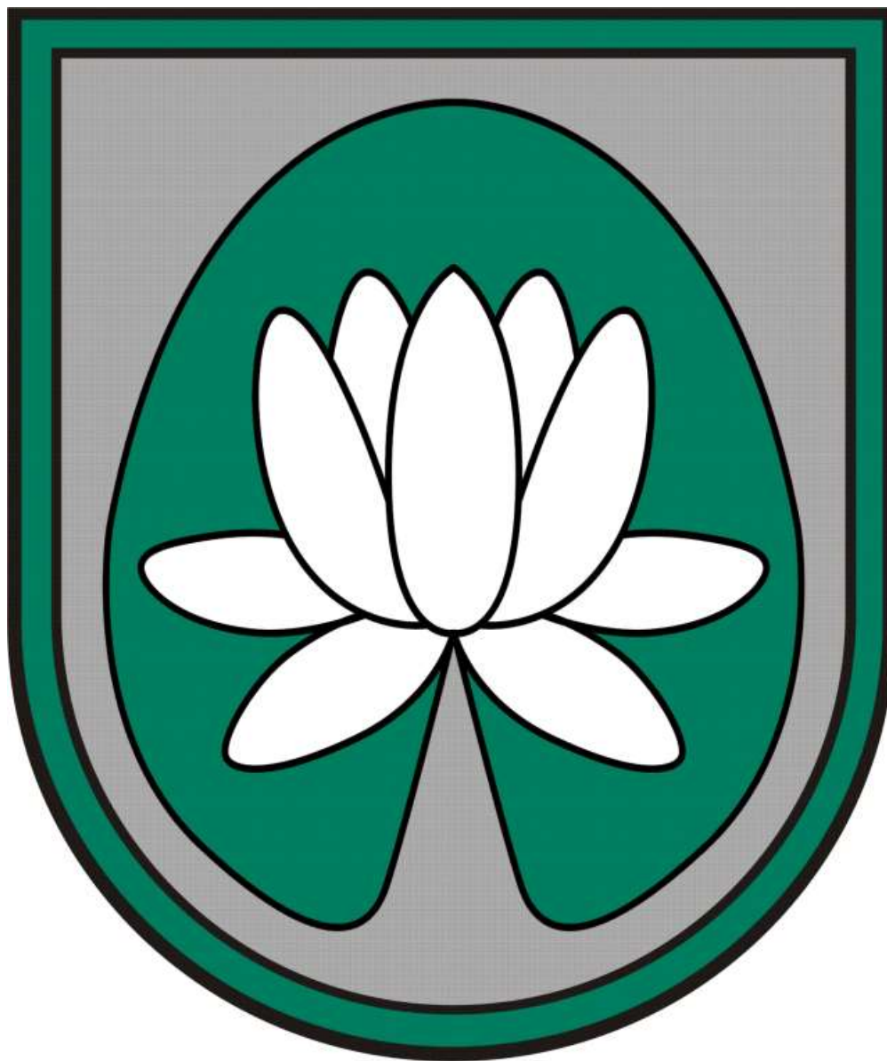
Ādažu novada ģerbonis

1.pielikums Ādažu novada domes 27.11.2012. saistošajiem noteikumiem Nr.34