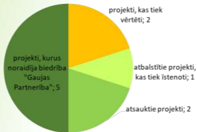
5.kārtas projektu vērtētāju un projektu īstenotāju lēmumi