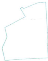
Projektētā teritorijas shēma pēc zemes ierīcības projekta izstrādes