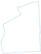
Projektētā teritorijas shēma pirms zemes ierīcības projekta izstrādes