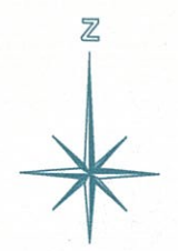
Inženierkomunikāciju shēma M 1 : 500