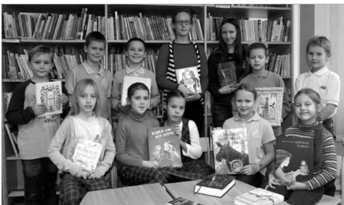
Ādažu vidusskolas 2.g un 9.a klases Bērnu žūrijas dalībnieki