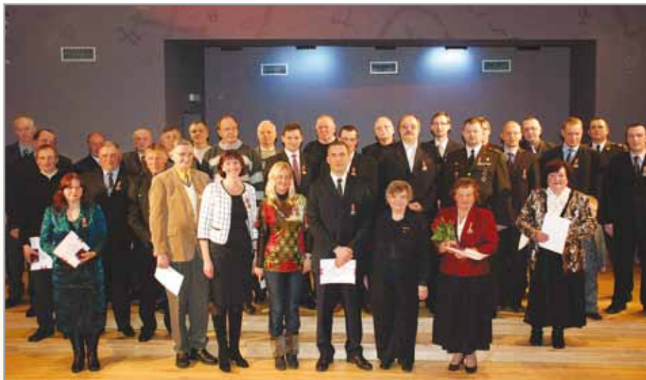
1991. gada barikāžu dalībnieku piemiņas zīmes saņēmēji