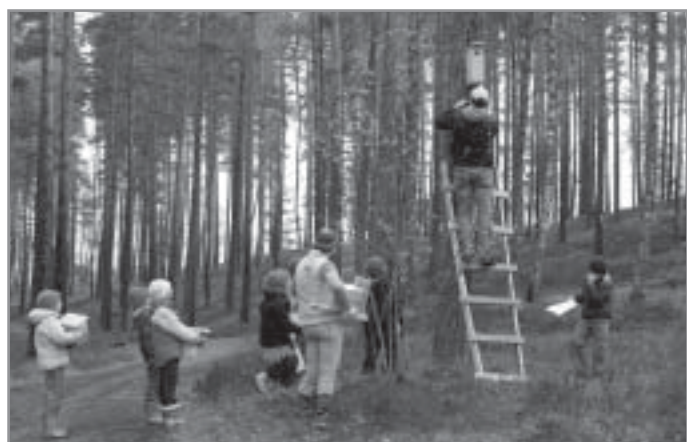
Putnu jaunās mājas

Ādažu vidusskolas 2. klašu skolēni un viņu audzinātājas