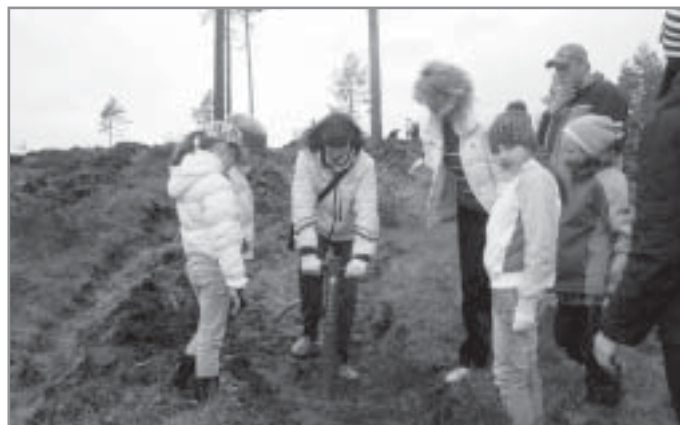
Stādam jauno mežu Lilastē

Šajā bargajā ziemā drošāk varēja justies putni, jo par tiem rūpējās otro klašu skolēni, gatavojot putnu barotavas un gādājot, lai tajās nekad netrūktu barības. Pavasaris atnāca ar Lielo talku. Jau būdami