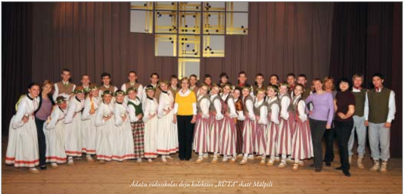
Ādažu vidusskolas deju kolektīvs „RŪTA” skatē Mālpilī