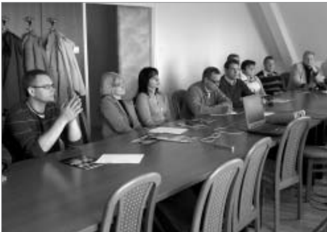
Diskusijas par vakuumkanalizācijas plusiem un mīnusiem

„Koval” pārstāvji deva iespēju iepazīties ar vakuumkanalizācijas sūkņu staciju, kura jaudas ziņā varētu būt līdzīga stacijai, kādu plānots uzstādīt pilotprojekta laikā pie Baltezera. Tikām iepazīstināti arī ar kanalizācijas sūkņu staciju (trīs galvenās vakuumkanalizācijas sūkņu stacijas) vadības sistēmu, kura atrodas Monor pilsētas attīrīšanas iekārtu teritorijā. ☼