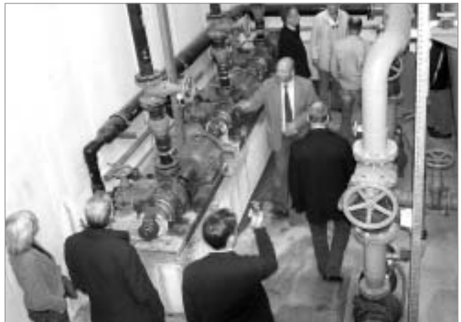
Monoras pilsētas galvenā vakuumkanalizācijas sūkņētava