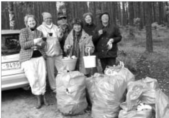
Ādažu kultūras nama darbinieki Lielajā Talkā