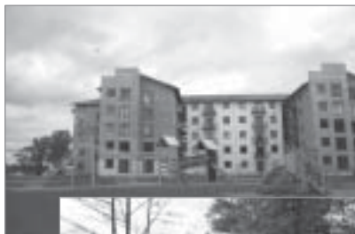
◀ „Podnieku kaimiņi” projekts „Bērnu priekam”