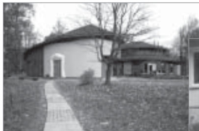
▲ „Ādažu Brīvā Valdorfa skola” projekts „Ādažu Brīvās Valdorfa skolas parka celīņa iekārtošana Ādažu centrā”