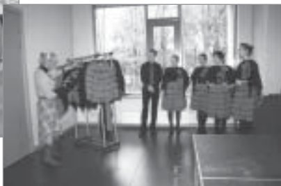
▲ „Jauniešu koris „Mundus” projekts „Jauniešu kora „Mundus” skatuves tērpu šūšana”