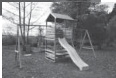
◀ „Baltezers Fani” projekts „Atpūtai un sportam”