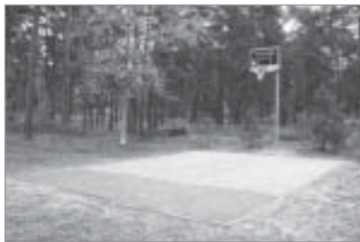
◀ „PROGRESSIO” projekts „Sportiskai Kadagai”